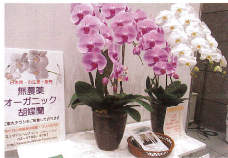
▲日本初、唯一の無農薬胡蝶蘭。殺菌・殺虫剤を使用しないクリーンな胡蝶蘭はお見舞い品にもおすすめ。3本立ち 38,000円～（ミュゼドハンナ）

が有機農業を志しているのが特徴。今後もこの動きは加速する。有機農業の促進には、消費者の庭やベランダでの栽培が、すくなくならずのインパクトをもたらすとオーガニックの今後を語った。