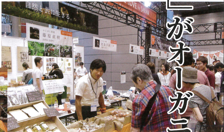
▲新規就農者を中心に、大地にやさしい農業を志す農家を応援する「SHARE THE LOVE FOR JAPAN」ブース。生産者と対話しながら購入できるのが大きな楽しみ

●7月28～30日●東京国際フォーラム ●主催：（一社）オーガニックフォーラムジャパン