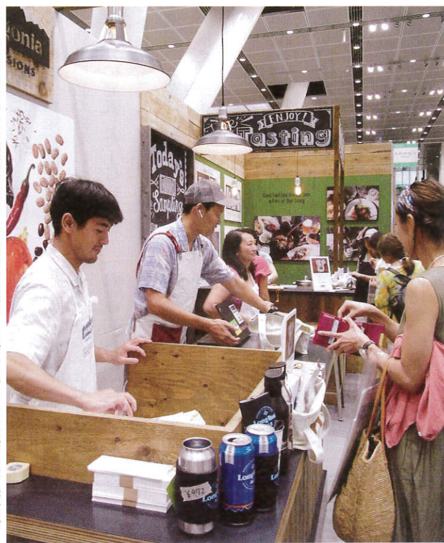
▲テイティングブースはども大盛況。人気のアウトドアブランド・パタゴニアは新しい食品ビジネス「パタゴニア プロビジョンズ」を展開している。オーガニック果実のエナジーバーや、環境再生型の農法で育てられた野菜を使ったスープなどはどれも美味しく、気軽に携帯できるのも大きな魅力