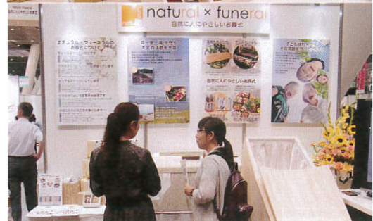
▲人にやさしいお葬式パッケージ「natural x funeral」が9月より関東エリアでサービス開始。間伐材の使用や植林寄付がついたお棺や、返礼品も無添加食品や非加熱の国産はちみつなどが選べる。収益の一部は自然環境と子供達を守る活動の支援に使われる（ひかりの和）