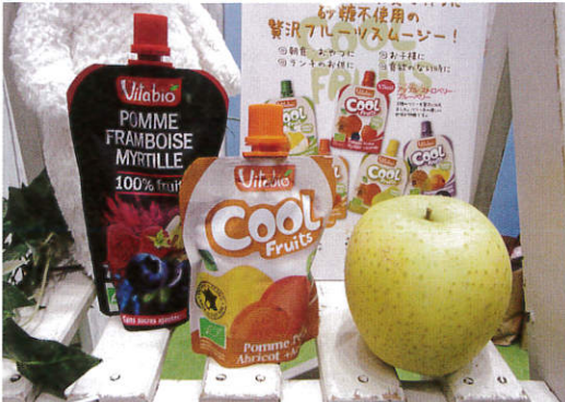
▲フランスで最初にオーガニックベビーミルクを開発したブランド「ベビービオ」の、砂糖不使用・有機果実と野菜のベビースムージーが上陸（ミトク）