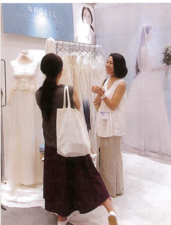
▲オーガニックコットンの衣類はメジャーになってきたが、ウエディングドレスは珍しい。長年のパートナー研究と日本の職人技術から生まれる「オーマル」でありながら着心地のいい「ナデル」のドレスは、花嫁の大切な日に軽やかに寄り添う一着（ハミング）