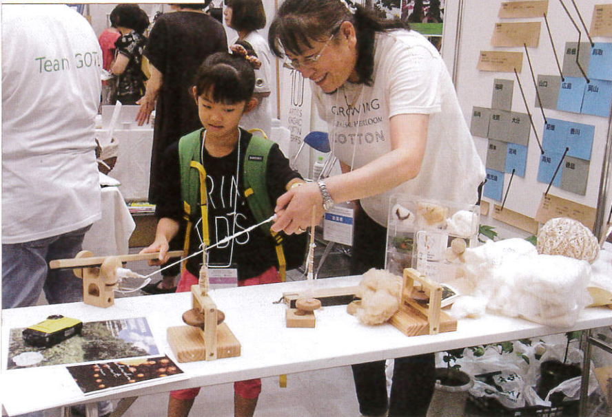
▲オーガニックコットンを紡ぐ実演ブース