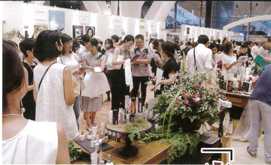
▲2万人の来場者のうち3分の2が入場料1000円を払ってでも詰めかける一般消費者。特にエシカルコスメゾーンは商品説明に熱心に耳を傾ける女性で溢れた。写真は福岡の「HANA オーガニック」