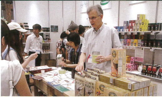
▲全米のオーガニックシリアル&グラノーラのトップブランド「ネイチャーズ パース」