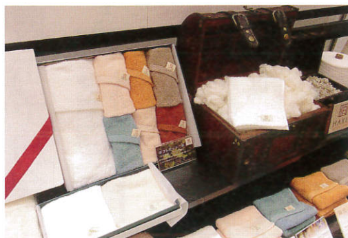
▲国内初、和綿（伯州綿）を使用したオーガニックコットン「伯」のギフトセット（きさざぎ 伯事業部）