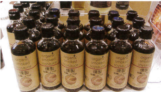
▲液体を直接燻製する特許製法で香りを液中に凝縮。完全無添加の、かすさスモーク「燻製有機しょうゆ」（リオ）