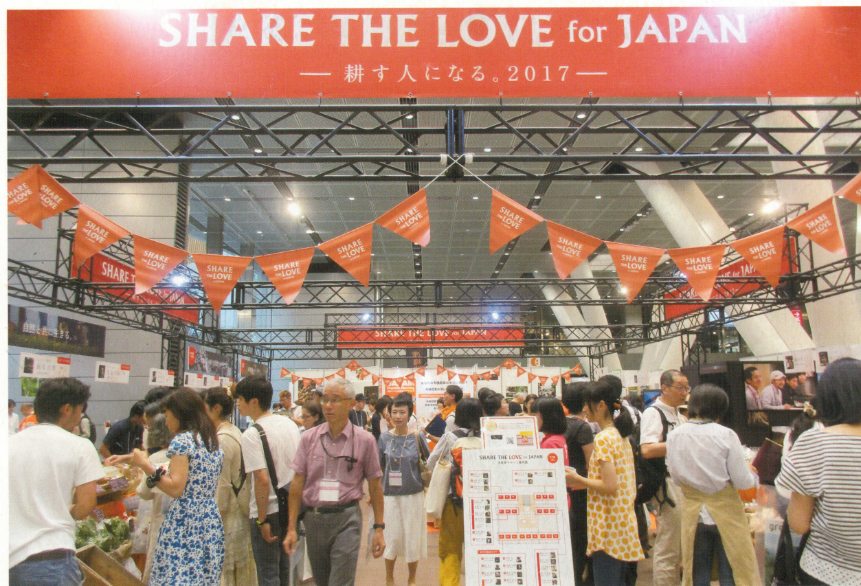
2017年7月28～30日、東京国際フォーラムで開催された「第2回オーガニックライフスタイルEXPO」

Eco-Agriculture Magazine “The Environment and Agriculture”