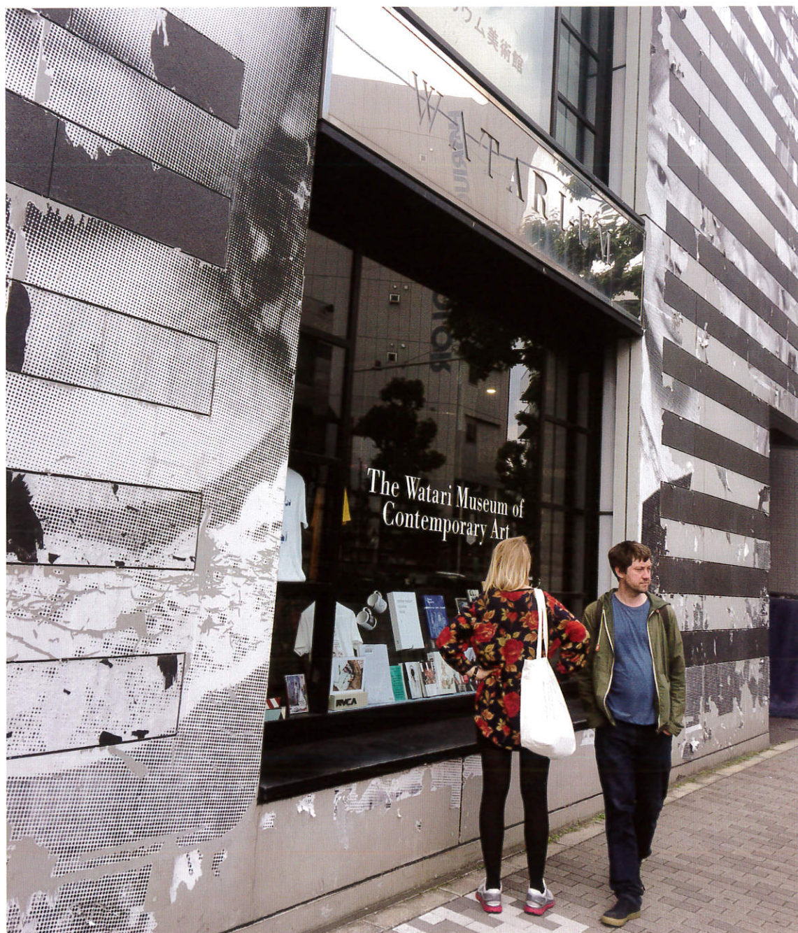
表紙 知的好奇心をくすぐるギフトが見つかる/ワタリウム美術館